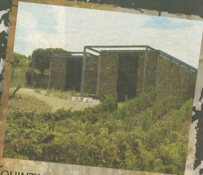
QUINTA DA TOURIGA-CHÃ A capela do Douro Superior

Tem 30 anos, é do Porto e vive em Arraiolos. Está entre dois mundos desde 2002, altura em que foi escolhida pelo Grupo Mello para ser a enóloga responsável pelo Monte da Ravasqueira. Esta licenciada em Enologia pela Universidade de Trás-os-Montes e Alto Douro (UTAD) não tem uma história familiar ligada ao meio vinícola, mas depressa se apaixonou pelo tema: "Sempre gostei de química, mas não para ensinar, era mais do género de alquimia. E descobri o vinho..." A alquimista dos tintos e brancos aponta para o rosé como um produto em crescimento no mercado português.